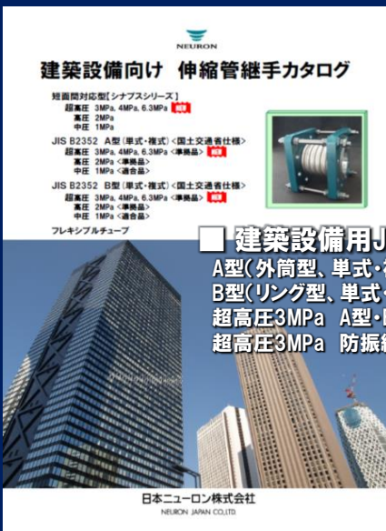
建築設備用伸縮管継手カタログ