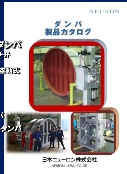
ダンパ製品カタログ