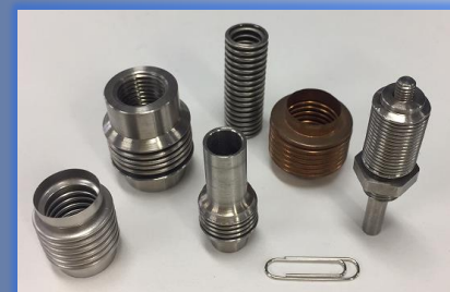
各種マイクロベローズ