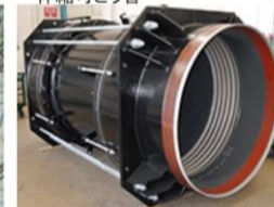
シナプスジョイント® 伸縮可とう管