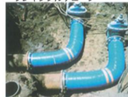
シナプスフレキ® フレキシブルチューブ