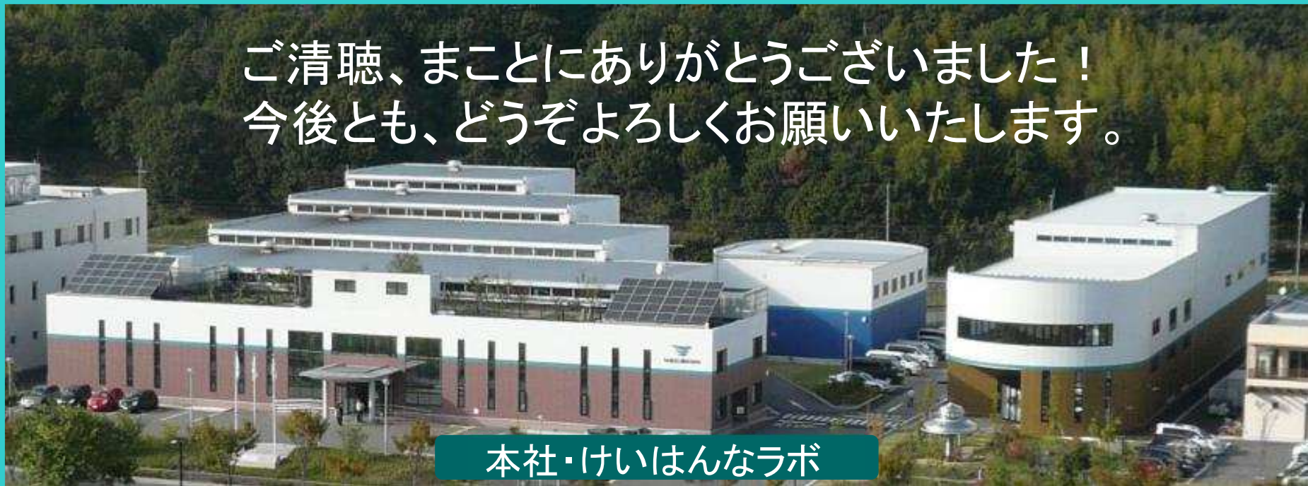
本社・けいはんなラボ

ご清聴、まことにありがとうございました！ 今後とも、どうぞよろしくお願ひいたします。