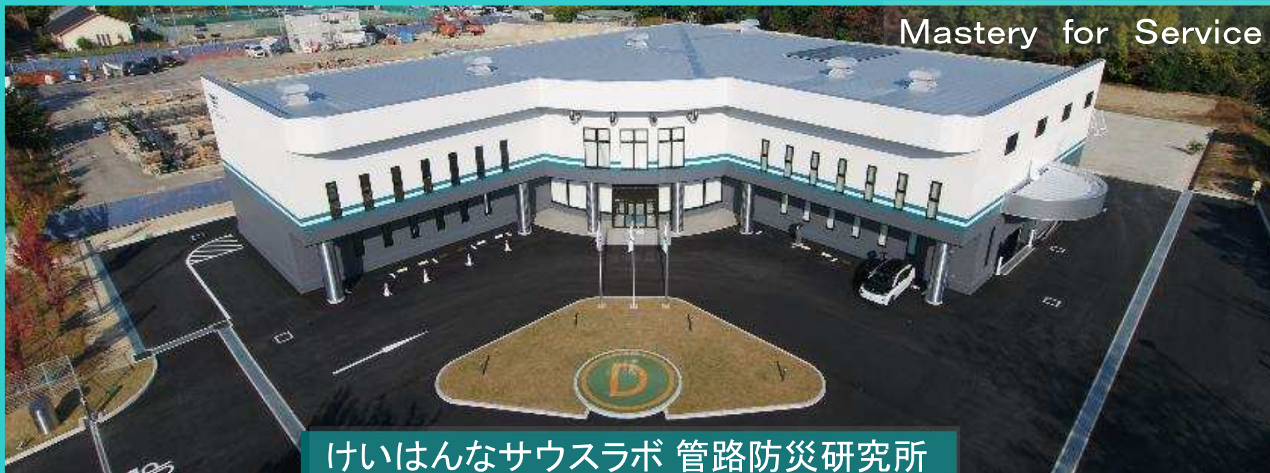
けいはんなサウ斯拉ボ 管路防災研究所