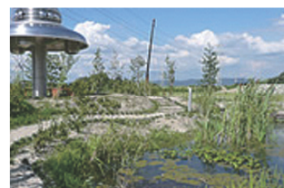
Biotope ビオトープ Providing biotope in order to ensure social and biological environmental protection, we are aiming to regenerate of endangered species.