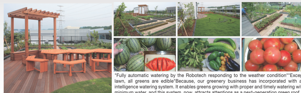
「ロボテックで気象に合わせて水やり全自動」「芝生以外は全て食べることができる菜園緑化」…当社の屋上緑化は日本初の「知能化制御灌水システム」を利用した屋上菜園です。気象予報情報や土中湿度計測データをもとに、ロボット制御で適切な水やりを行うため、少ない水量で効率よく植物や作物を育てることが出来る「次世代型屋上緑化」としてマスコミを初め多くの方面から注目されています。