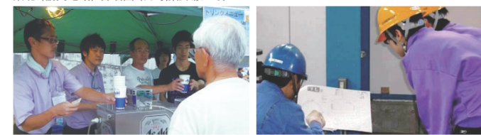
Participate in community events. 地域イベントに参加