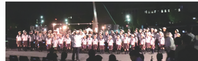
Tohoku district choir group (devastated area) at Solar Clock plaza. 東北(被災地域)合唱団(日時計広場にて)