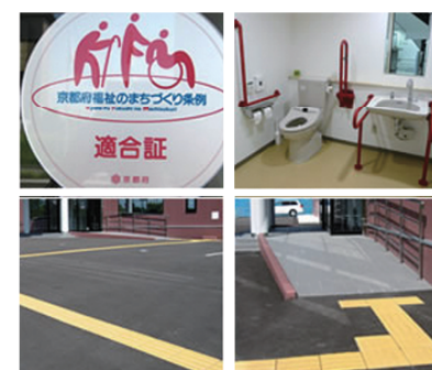
Consideration of the physically handicapped person お身体が不自由な方への配慮