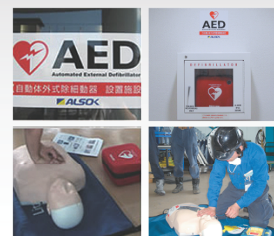
AED (automatic external defibrillator) AED(自動対外式除細動器)設置