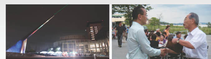
Radiating LASER beam from solar clock at Keihanna district. けいはんな日時計のレーザービーム