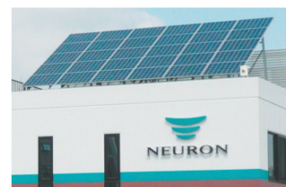
Photovoltaics 太陽光発電 A solar power generation system (10kw) has been introduced since 2007.